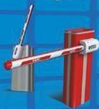
Gate Barrier Systems