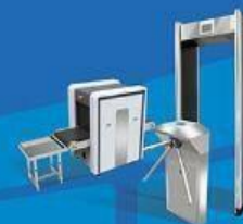
Metal Detector & Walk Through Gates