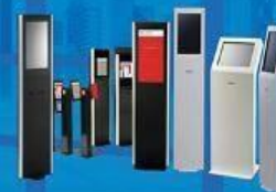
Queue Management Systems