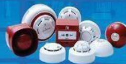
Fire Alarm Systems